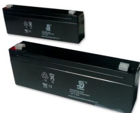
175 x 30 x 60mm 5070655