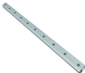
1.000 x 30 x 50mm 5070665