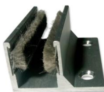
76 x 40 x 3.7mm 5070670