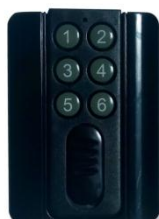
85 x 6.2 x 10mm 5070680