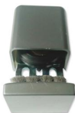
56 x 40 x 2.5mm 5070675